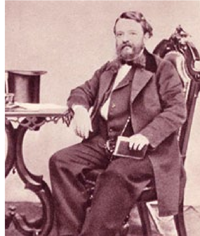
Francesco Maria Piave